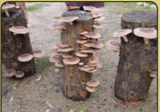
སོན་དུམ་འཇོང་

སོན་དུམ་ཚུ་ གོ་ཡང་འཇོང་འཇོང་སྤུང་ ཡང་མྱོང་བཞག་པའི་བཞག་ལས་ ཉིན་ ༥ དང་ ༧ གྲིབ་ར་ འཇོང་སྤུང་ཚུ་འཇོང་རན་མེ་ཡིན། འཇོང་སྤུང་ཚུ་ ལས་ སོན་དུམ་ཚུ་ གྲུ་གཞན་ བཞག་སྤུང་སྤུང་ ༢ དེ་ཅེག་འགོ་མཚུ་བཞག་དགོ། དེའི་སྤུང་ལས་ ༥ དང་ ༧ ཉིན་བཟུམ་སྤུང་ ཚུ་བཞག་སྤུང་ འཇོང་སྤུང་ཚུ་གོ། དེ་བཟུམ་སྤུང་ འཇོང་སྤུང་བཞག་མ་ཚུ་ཚོད་ འཇོང་དུམ་ཚུ་ ཚུ་བཞག་སྤུང་ འོག་ ཅོར་ འཇོང་སྤུང་ཚུ་བཞག་དགོ།