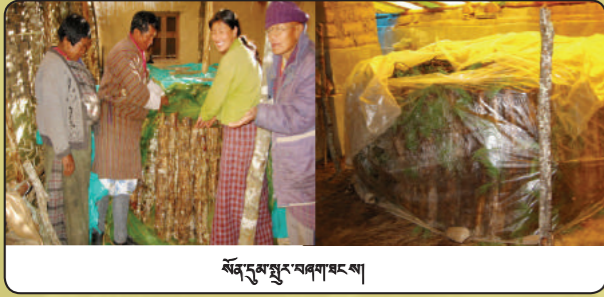
སོན་དུམ་སྤུང་བཞག་ཐང་སྒྲིབ་

རིགས་དང་ བཞག་འབྲས་ཚུ་གིས་ གཞོན་པ་རྒྱབ་མཚུགས་པའི་ ཚད་ལྡན་ གཞན་གཤམ་གཤམ་གཞན་སྤུང་སྤུང་ཐབས་ལུ་ཡིན།