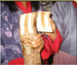
སོན་འཇོང་དུམ་ནང་ན།

དེ་སྤེ་ ཐང་ཚུ་འོས་ལས་ ཚུ་བཞག་བཞག་སྤེ་ སྤུ་ལས་ ཚུ་འོག་ ཐང་བཞག་དགོ། དེ་ལས་ གཞན་གཤམ་གྲི་དྲོད་གཤམ་དང་འབྲེལ་ ཉི་ཉིན་ ༢ དང་ ༦ གི་ནང་འཇོང་ འཇོང་སྤུང་ཚུ་འོག་བཞག་འོང་།