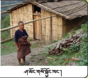
འཇོང་གསལ་སྤུང་ཐང་།