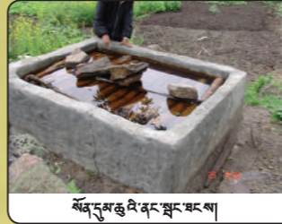
སོན་དུམ་ཚུ་འཇོང་སྤུང་ཐང་སྒྲིབ་