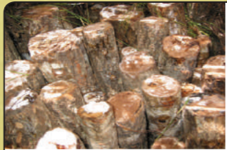
སོན་འཇོང་དུམ་ནང་ཚུ་བཞག་ཡོད་པ།

དུམ་ཚོད་ གཞན་སྤུང་ས་ལེགས་འོས་ཐོག་(དྲོད་ཚད་དང་ མྱོན་གཤམ་) བཞག་པའི་སྤུང་སྤུང་འཇོང་དུམ་ཚུ་འཇོང་སྤུང་སྤུང་ཚུ་འཇོང་རན་པར་ ཉིང་འོས་སྤུང་ ༦ དེ་ཅེག་འགོ་མཚུ་ཡིན། དུམ་ཚོད་རན་མེ་རན་དེ་ ཡང་ འཇོང་དུམ་གྲུ་ མྱོང་ཉིང་དང་ ཚོས་གཞི་ཚུ་ལུ་བཟུམ་ཡིན། དུམ་ཚོད་རན་མེ་ཅེག་ འཇོང་དུམ་ཚུ་ མྱོང་ཉི་ཉི་དང་ ཡང་འཇོང་འཇོང་ ཚོས་གཞི་ཡང་ མྱོང་སྤུང་སྤུང་ཐང་སྤུང་སྤུང་ སོན་དུམ་ཚུ་ ཚུ་བཞག་དགོ། རི་དུམ་ཚོད་རན་མེ་ཡིན། སོན་དུམ་ཚུ་ མྱོང་ཉིང་དང་འབྲེལ་ཉེ་དུམ་ ཡུལ་ཚུ་ཚོད་ ༡༢ ལས་ ༢༥ ཚུ་བཞག་ཚོད་ཉིང་དང་ཐང་བཞག་དགོ།